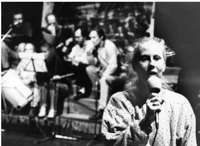
Musiikkiteatteria Pentti Saarikosken teksteihin